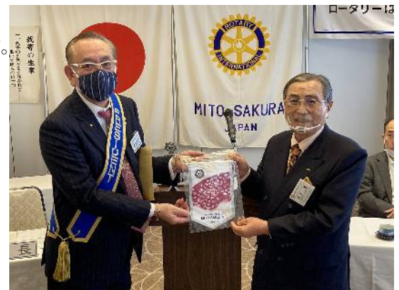
左から、阿部会長、篠田会員