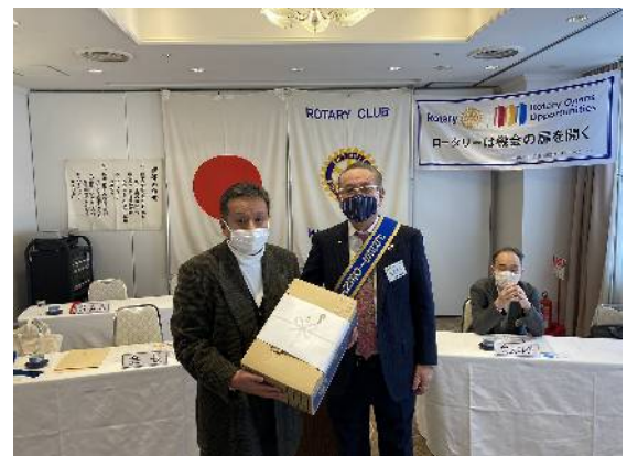
左から、井坂会員、阿部会長